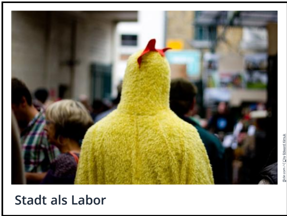
Stadt als Labor

Verknüpfung mit Sozialleben, den ökologischen Kreisläufen, wirtschaftlichen Kreisläufen, Kultur der Stadt Urbanes Ernährungssystem Steht in, beteiligt sich an städtischen Aushandlungsprozessen. Beziehungen/Warenströme haben regionale bis globale Ausprägungen, Präferenz des Regionalen