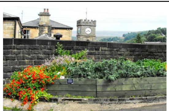
Incredible edible Todmorden

only food has been absent over the years as a focus of serious professional planning interest.”