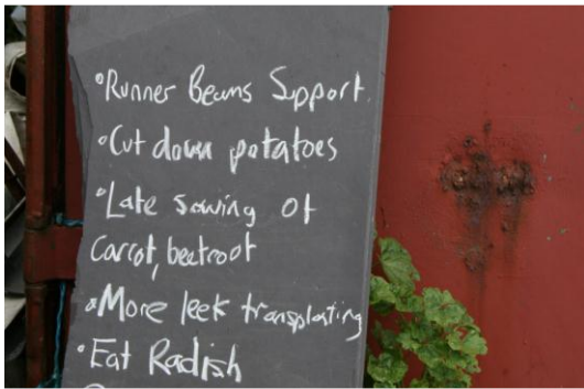
Food Partnership Brighton and Hove

AIM 5 More food consumed in the city is grown, produced and processed locally using methods that protect biodiversity and respect environmental limits.