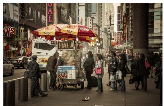
FoodWorks New York